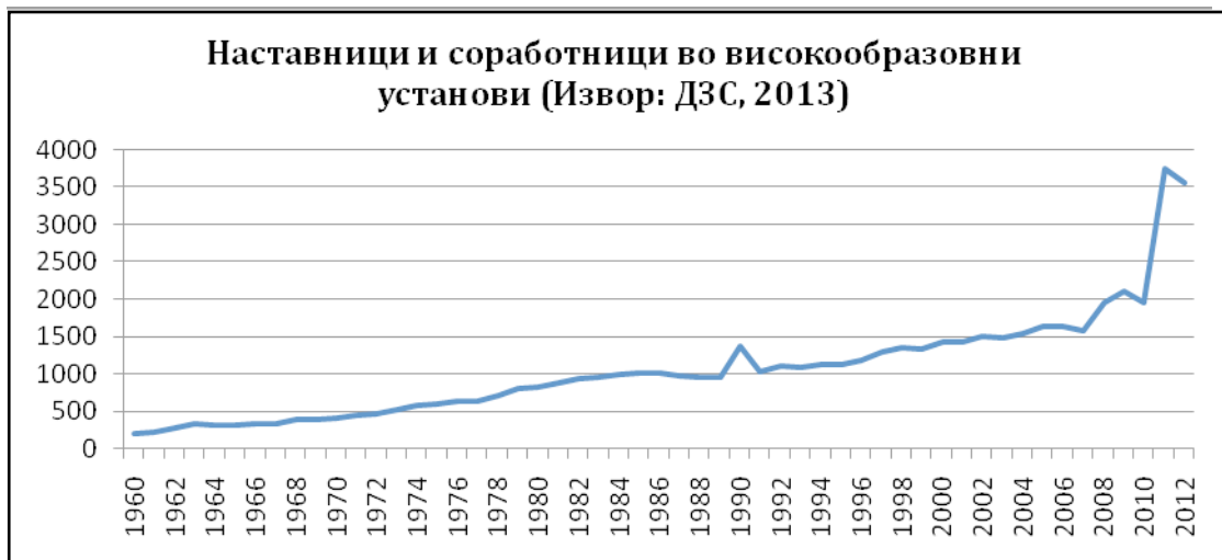
ТАБЕЛА 2 НАСТАВНИЦИ И СОРАБОТНИЦИ ВО ВИСОКООБРАЗОВНИ УСТАНОВИ (1960-2012)

Бројот на наставници и соработници на високообразовните установи во академската 2013/2014 година изнесува 3 354 лица. Од вкупниот број наставници и соработници, 2 301 лице се наставници или 68,6 % и 1 053, т.е. 31,4 %, се соработници во наставата.